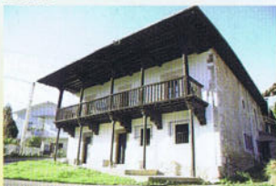
Casa de Trespando