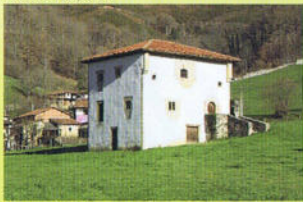
Torre de Sirviella