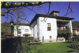
Desde la Cueva