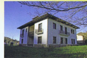
La casa Abaju