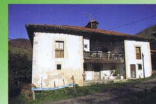
Casa del Campu

De nuevo nos dirigiremos hacia Benia de Onís y finalizaremos así el recorrido de esta ruta (poco más de 2 horas) que transcurre, toda ella, por carreteras menores, muy amenas, y perfectamente asfaltadas.