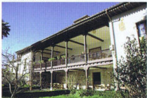
Casa de Luis Pellico