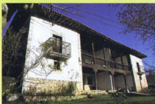
Casa del Colladín