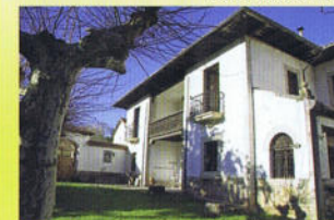
Casa Filomena Pellico